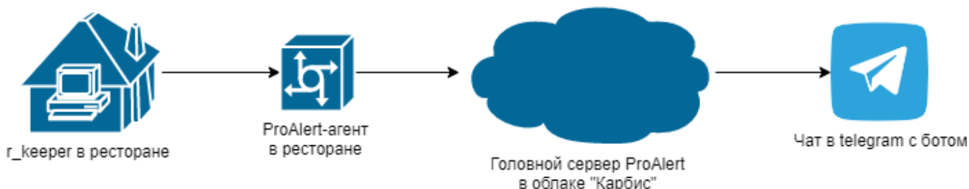
Схема работы в случае если уведомления из нескольких ресторанов подключены в общий чат: