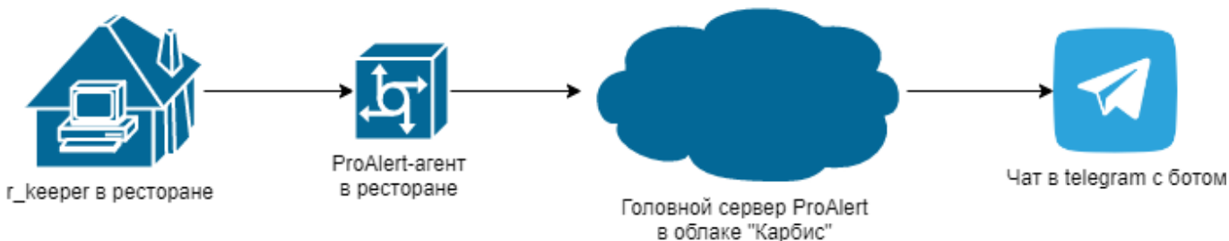
Схема работы в случае если уведомления из нескольких ресторанов подключены в общий чат: