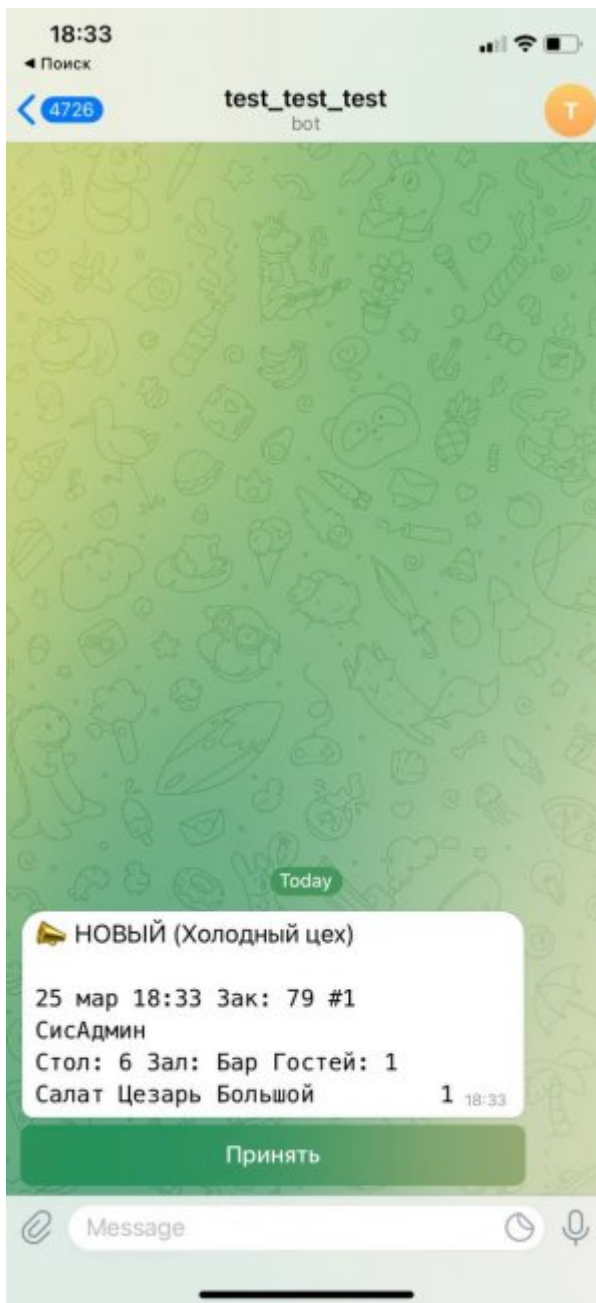
Печать сервис-чеков из системы iiko