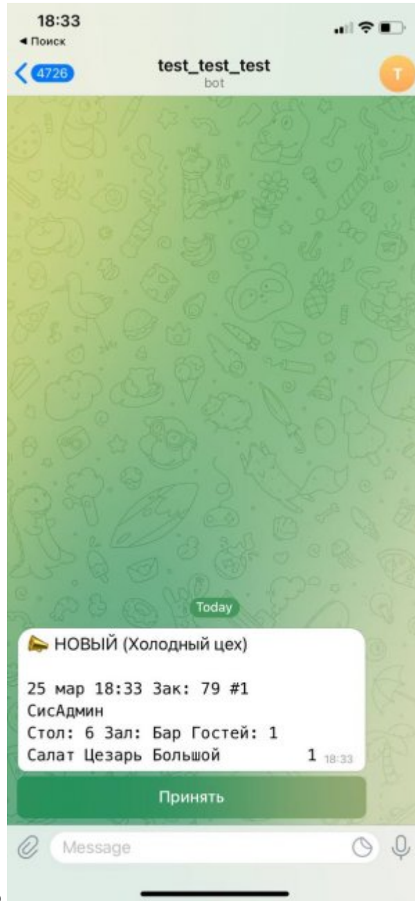
Печать сервис-чеков из системы iiko